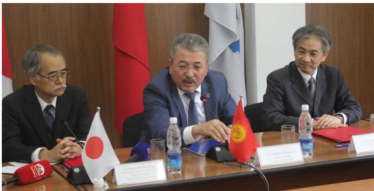
Во время Церемонии