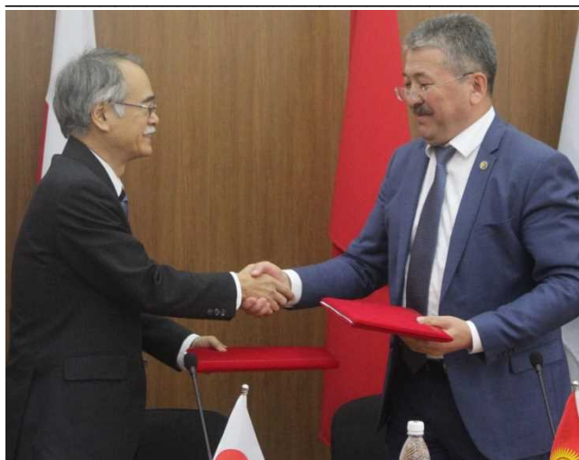
Подписание обменных нот

Правительство Японии ожидает, что стипендиаты программы JDS обретут профессиональные знания и повысят квалификацию во время обучения, установят контакты и обменяются опытом с участниками из других стран, а в последующем применят приобретенных знания и навыки в решении социально-экономических проблем, и таким образом, внесут свой вклад в развитие страны и повышение благосостояния населения Кыргызской Республики.