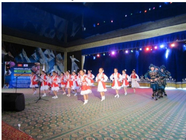
Танец «Кара жорго», в исполнении группы «Назик»