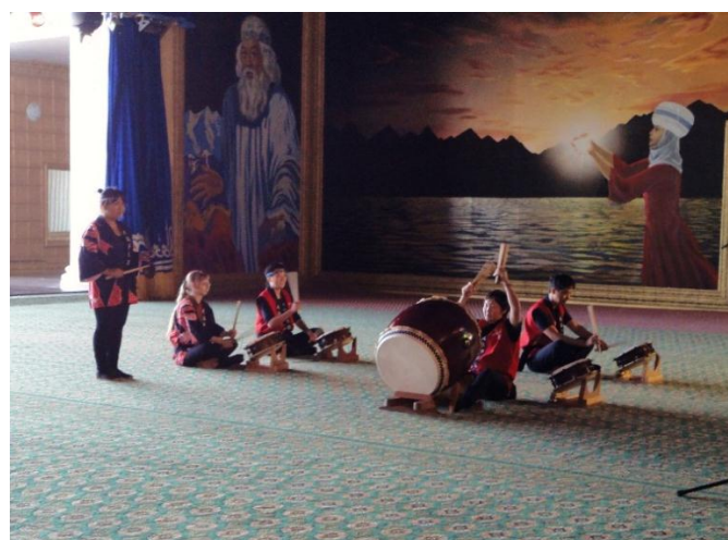
Выступление группы «Ооэдодайко»