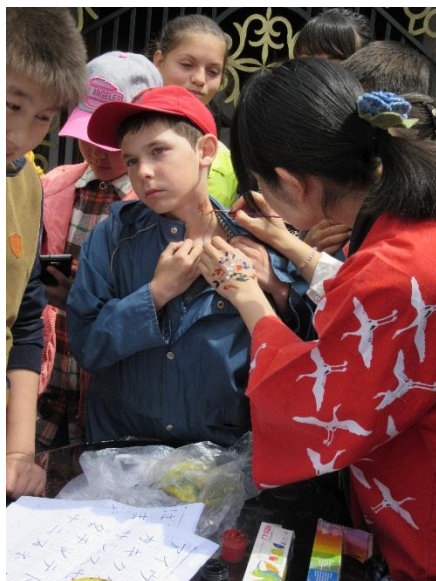
уголок «Body painting»

Место: г. Чолпон-Ата, Культурный центр «Рух Ордо»