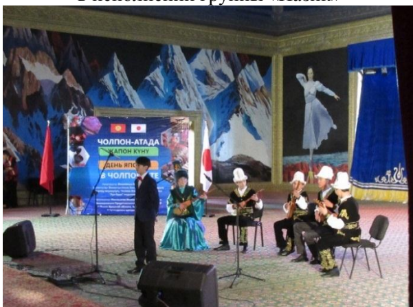
Японская песня «Соушюнфу», в исполнении учащихся ДМШ им. К. Орозова