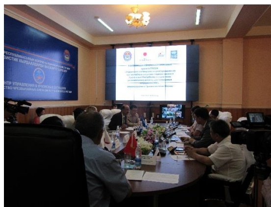
Презентация об итогах проекта