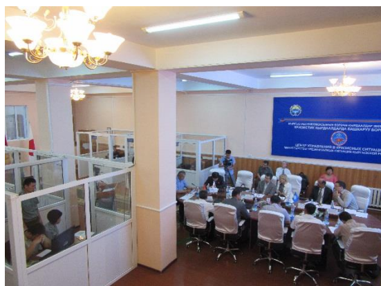
Центр управления кризисными ситуациями в г. Ош