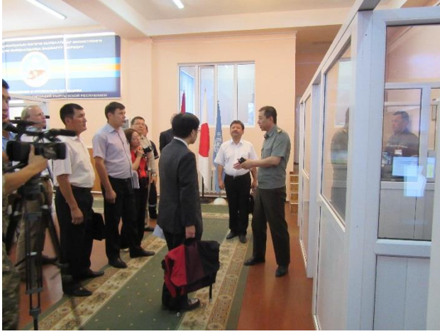
Ознакомление с деятельностью ЦУКС