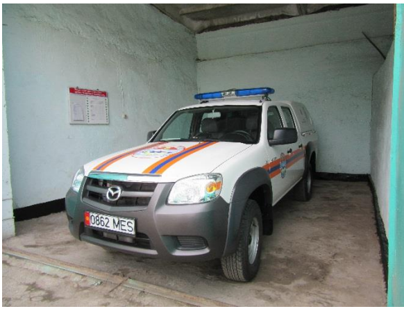
Переданная по проекту автомашина