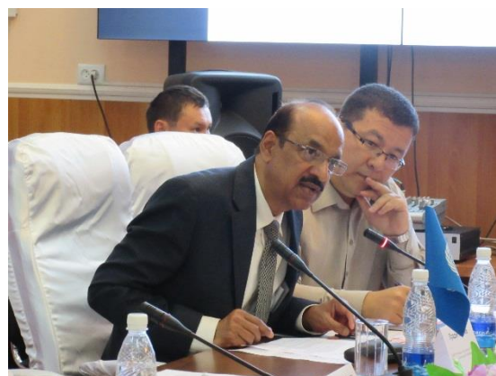
Речь в.и.о. Постоянного Представителя ПРООН г-на Шарма