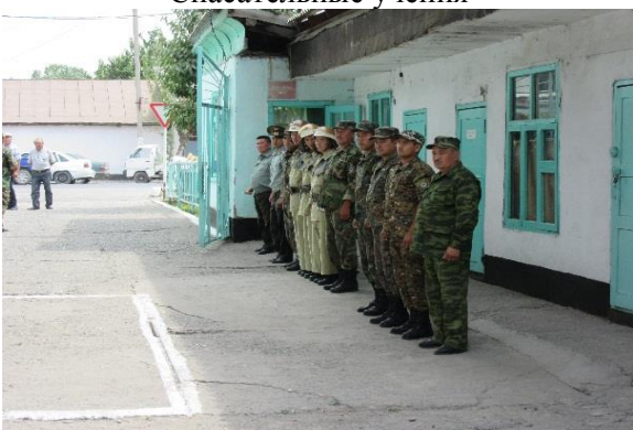
Построение сотрудников пожарной службы