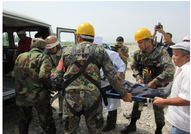
Спасательные учения 2