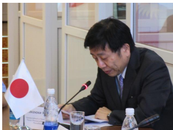
Выступление Посла Японии г-на Коикэ