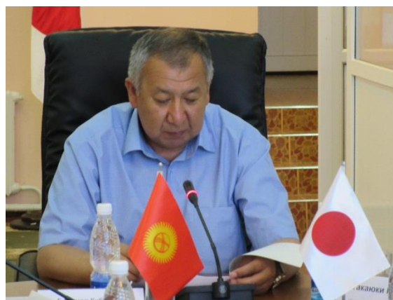
Приветственная речь Министра чрезвычайных ситуаций г-на Боронова