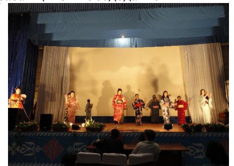
Танец «Юмэ то хазакура» в исполнении волонтеров ЛСА и сотрудников SOS Детской деревни