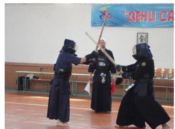
Во время турнира