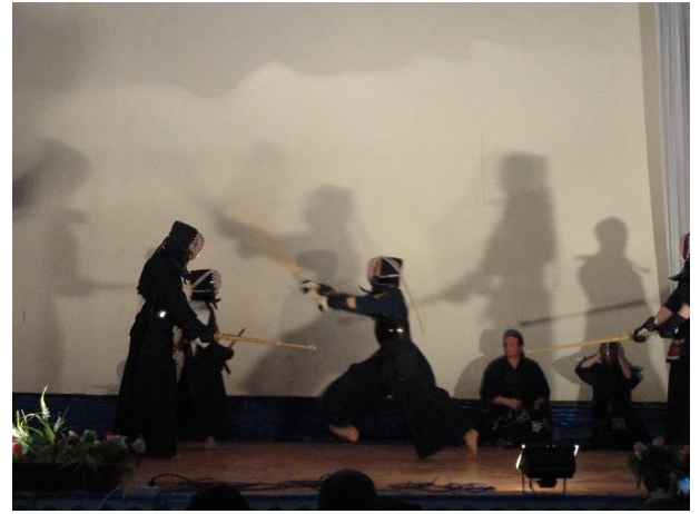
Демонстрация Кэндо, Кыргызская федерация Кэндо