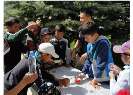
Уголки японской культуры: каллиграфия, надевание юкаты и традиционные детские игры