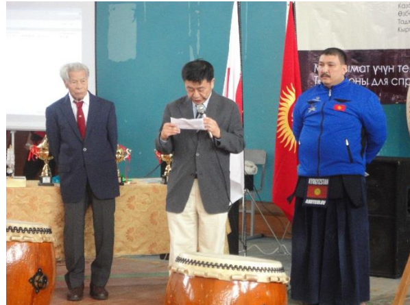
Приветствие ЧПП Японии в КР г-на Т. Коикэ