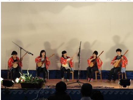
Композиция «Алтын балалык», в исполнении волонтеров ЛСА