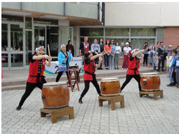
Выступление группы японских барабанщиков «Ооэдодайко»