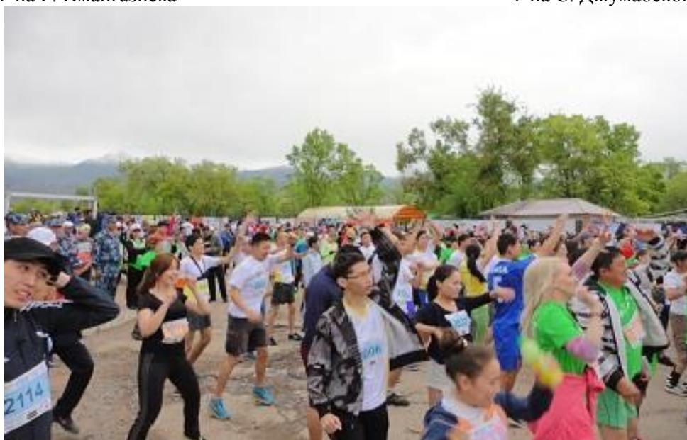
Участники марафона во время разминки