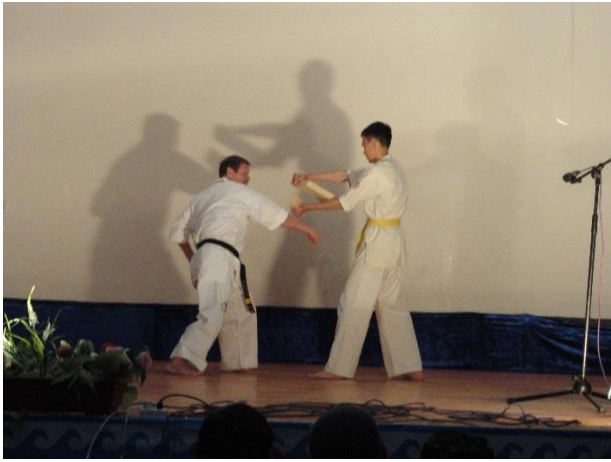
Демонстрация Каратэ, Федерация «Шинкёкушинкай»