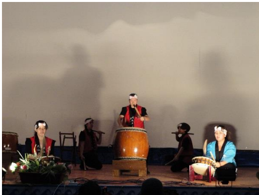
Выступление группы «Оозодайко»