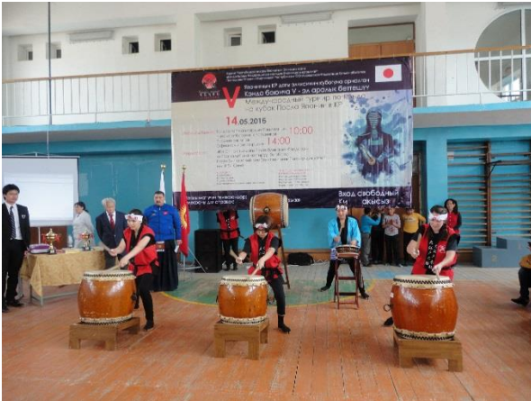
Официальное открытие турнира с выступлением «Ооэдодайко»

Место: Республиканский реабилитационный центр для детей им. Ибн Сина