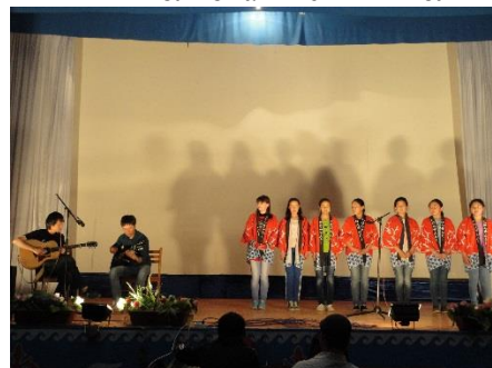
Песня «Секаини хитоцу дакэно хана» в исполнении учеников школы им. Осмонова