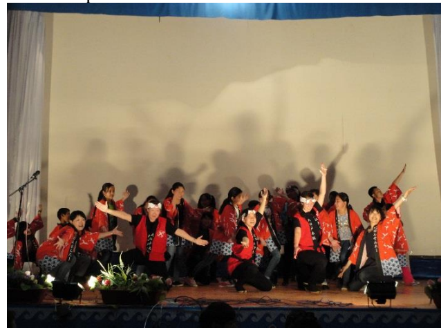
Танец «Соран», в исполнении японских волонтеров ЛСА, учеников Чолпонатинских школ и барабанщиков «Оозодайко»