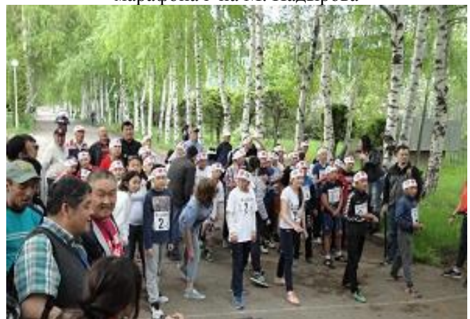
Участники марафона (5 команды)