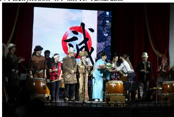
Благодарность от зрителей