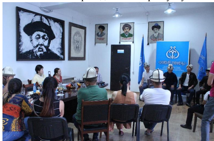
Встреча в МОФ «Саякбай Манасчы», юные манасчы знакомят гостей с эпосом «Манас»