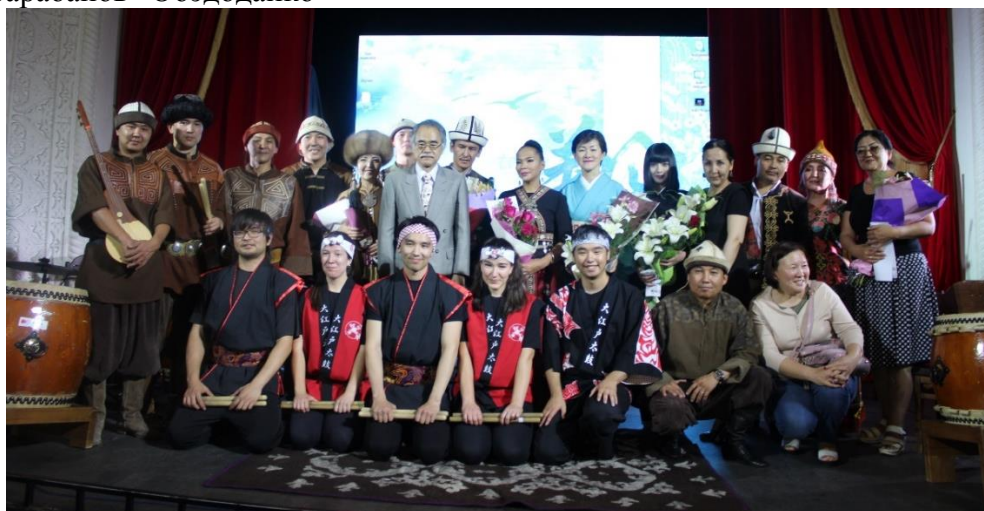
Памятная фотография с участниками творческого вечера