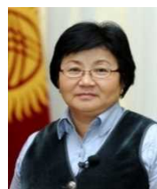
第3代オトゥンバエヴァ大統領