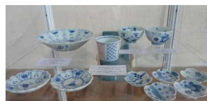
巡回展「手仕事のちから ー伝統と手わざ」展示物