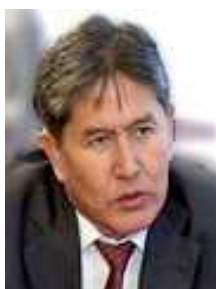
アタムバエフ大統領