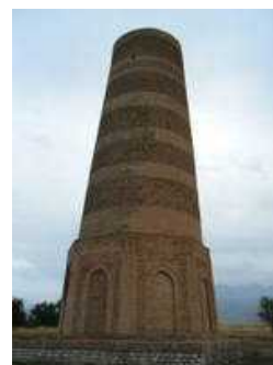
カラハン朝首都バラサゲンにあったブラナの塔