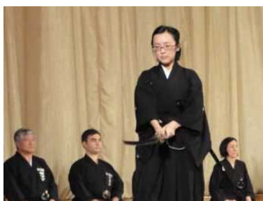
日本音楽・武道祭 (第6回日本総合紹介週間)