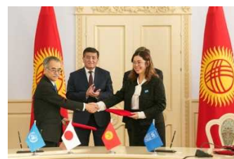
平成 28 年度学校安全プログラム支援計画 (UNICEF 連携)