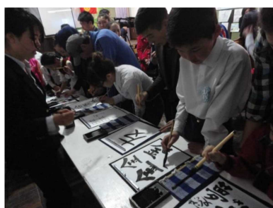
ナリン子供センターの 生徒による書道体験