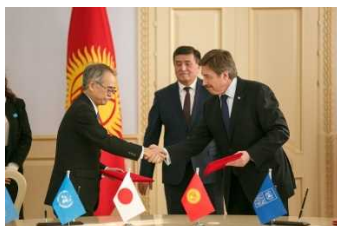
H28 年度電子政府システム設立のための国家統一住民登録支援計画 (UNDP 連携)