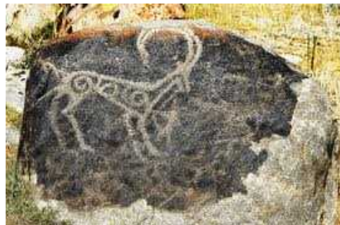
紀元前7世紀頃の岩絵

1917年のロシア革命後、ロシアは帝政が終わり、ソビエト連邦が成立。キルギス地方は、ロシア共和国内の「トルキスタン自治ソビエト社会主義共和国」の一部となり、その後、1924年には、中央アジアに位置する共和国の国境が整理され、「カラ・キルギズ自治州」となった。