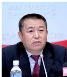
トゥルスンベコフ議会議長