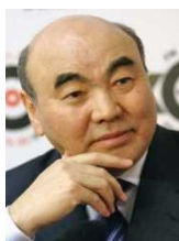
初代アカーエフ大統領

2011年12月末のオトゥンバエヴァ大統領の任期切れに伴う大統領選挙が、同年10月30日に実施され、アタムバエフ候補(当時首相)が62.52%の得票を得て圧勝。12月1日に大統領就任し、初めて選挙を通じた平和的な権力移譲が行われた。また、12月16日に社会民主党を中心とした4党による連立与党が結成され、ジェエンベコフ(社会民主党)がキルギス議会議長に選出され、同月23日にババノフ内閣が組閣され、アタムバエフ政権が本格的に始動した。その後アタムバエフ大統領は親露姿勢を強め、2014年12月にユーラシア経済同盟加盟条約に署名。2015年8月に関係国の批准が終了、ユーラシア経済同盟に正式加盟した。2016年12月11日に憲法改正に関する国民投票が行われ、賛成多数により可決、翌1月15日に施行された。