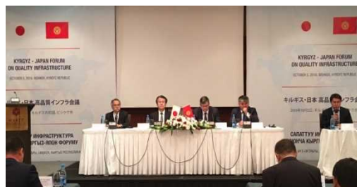
第1回日・キルギス官民インフラ会議

2016年10月, ビシュケクにおいて, 国土交通省と経済省傘下の投資促進庁(当時)が主催して「第1回日・キルギス官民インフラ会議」が開催され, 日本から花岡国土交通審議官及び清水建設, 日鐵住金, パナソニック, 日本信号, 三菱商事, 伊藤忠等約20社(43名)が参加し, 日本の「質の高いインフラ」技術の紹介とキルギス側のインフラ需要に関する紹介が行われた。2017年4月にビシュケクで麦島大臣官房審議官参加の下, 「質の高いインフラ」セミナーが開催され, 第2回会議は2017年9月に東京で開催された。