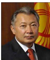
第2代バキーエフ大統領