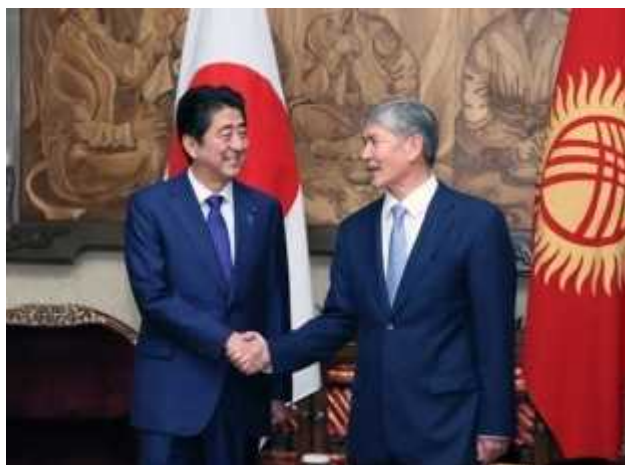
安倍総理のキルギス訪問(2015年10月26日)