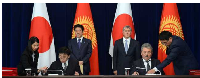
円借款「国際幹線道路改善計画(オシュ・バトケン・イスファナ道路改修及びビシュケク・オシュ道路防災対策)」の書簡交換(2015 年 10 月 26 日, 安倍総理訪問時)

1993 年度「リハビリテーション借款」(65.00 百万ドル)/1994 年度「セクター・プログラム借款」(31.27 百万ドル)/1996 年度「マナス空港近代化計画」(54.54 百万ドル)/1996 年度「ビシュケク・オシュ道路改修計画」(30.16 百万ドル)/1998 年度「ビシュケク・オシュ道路改修計画」(II)(52.50 百万ドル)/1999 年度「社会セクター調整計画」(23.18 百万ドル)/2016 年度「国際幹線道路改善計画(オシュ・バトケン・イスファナ道路改修及びビシュケク・オシュ道路防災対策)」(119.15 億円)