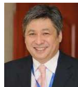
アブディルダエフ外相