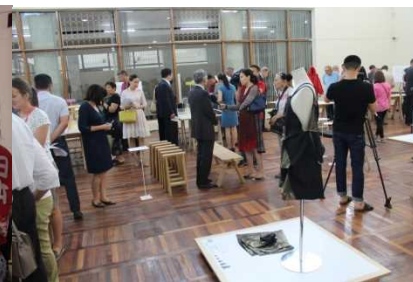
現代日本のデザイン100選