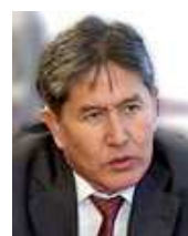
第4代アタムバエフ大統領