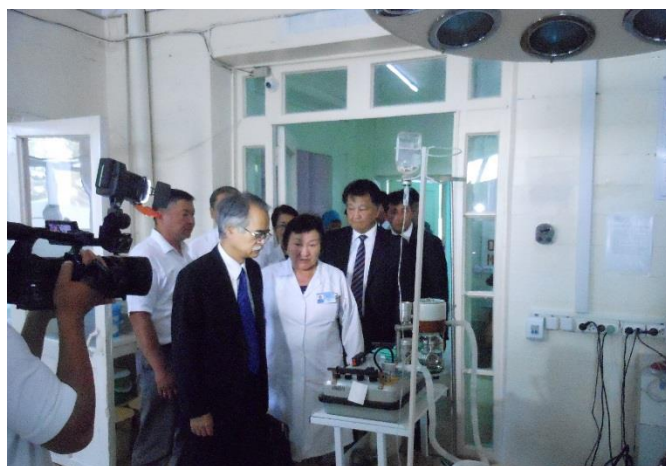
Осмотр медоборудования Токмокской ТБ