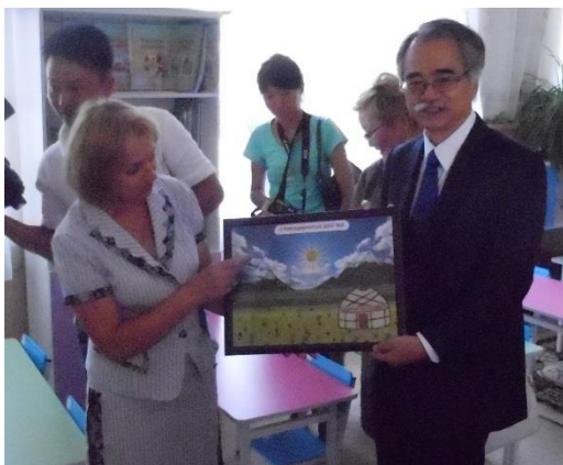
ДО.№2, родители воспитанников вручают подарок Послу

Оказание данной грантовой помощи подтверждает усилия Японии, направленные на обеспечение человеческой безопасности – одного из приоритетных направлений японской международной политики.