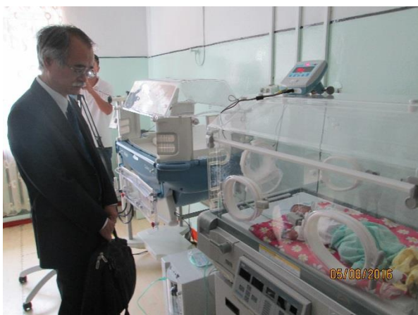
Осмотр родильного отделения Токмокской ТБ