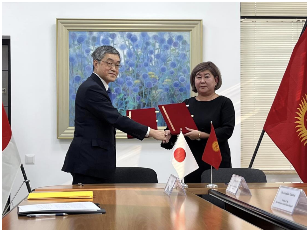
во время подписания грант контрактов