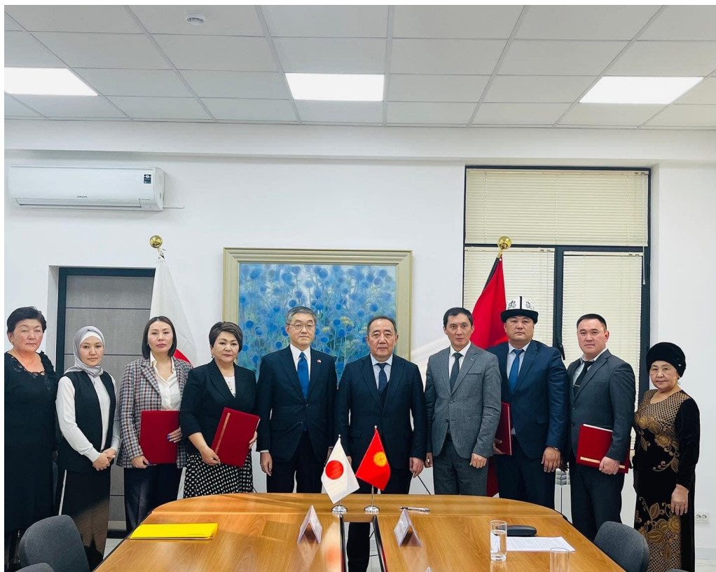
Общее фото участников

«Проект по предоставлению оборудования для выпуска учебников на шрифте Брайля»