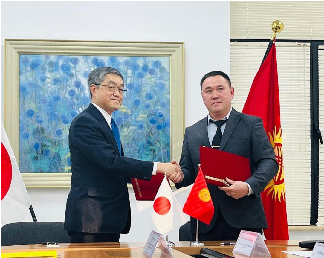
во время подписания грант контрактов