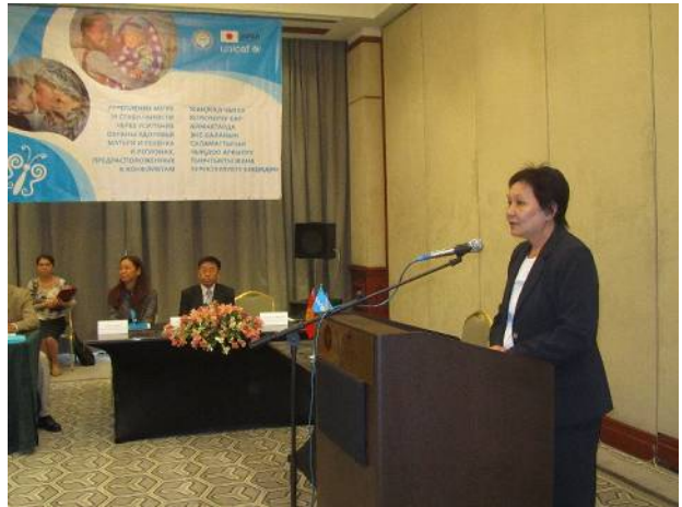
サギムバエヴァ・キルギス保健大臣挨拶