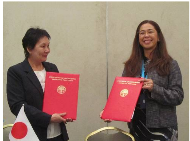
サギムバエヴァ・キルギス保健大臣と壺尾 UNICEF キルギス事務所長との間の文書署名