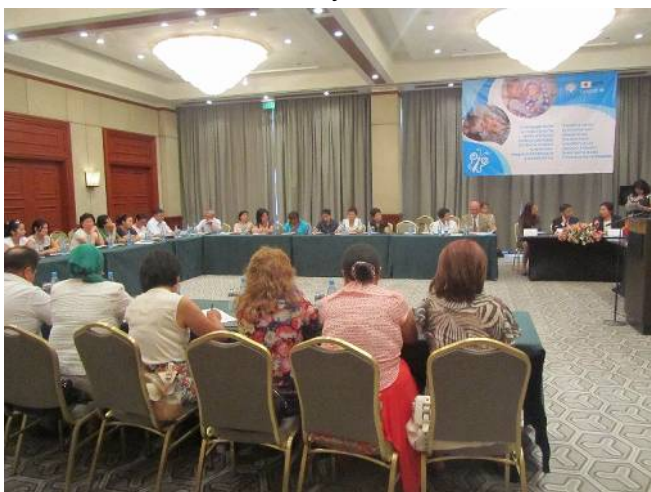
Вопросы и ответы