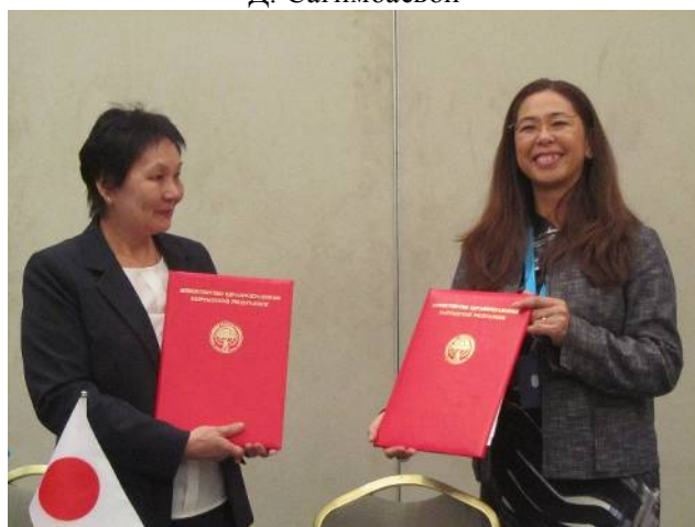
Соглашение о реализации гранта между Министерством здравоохранения и Представительством ЮНИСЕФ в КР