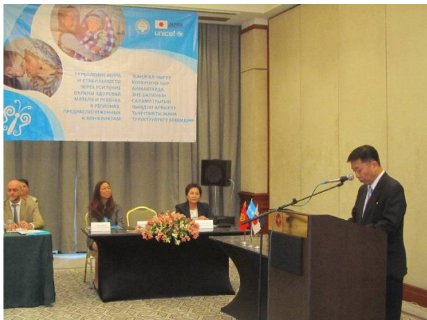
Приветствие Е.П. Чрезвычайного и Полномочного Посла Японии в КР г-на Такаюки Коикэ

31 июля 2014 г. Посольство Японии в КР Место: отель «Хаятт Ридженс Бишкек»