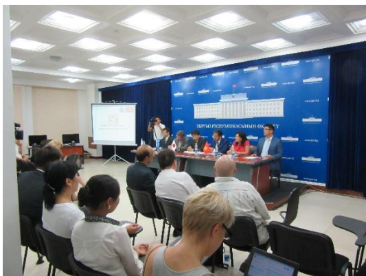
Место проведения Церемонии

3 августа 2015 года Место: Дом Правительства, Пресс-Центр