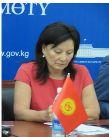
Выступление Заместителя Председателя ЦИК г-жи Г. Джурабаевой