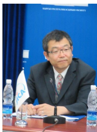
Речь Постоянного Представителя JICA в КР г-на Т. Ояма