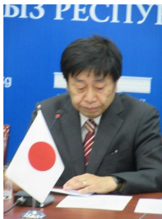
Речь Посла Японии г-на Т. Коикэ