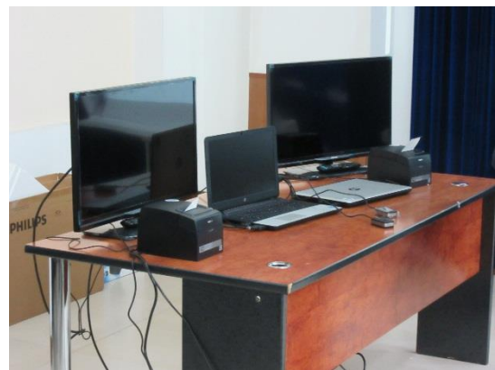
Модель переданного оборудования