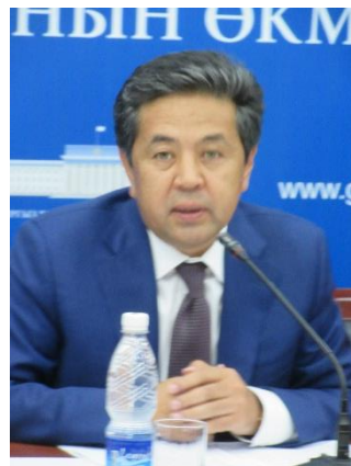
Речь Первого Вице-премьер-министра КР Е.П. г-на Т. Сарпашева