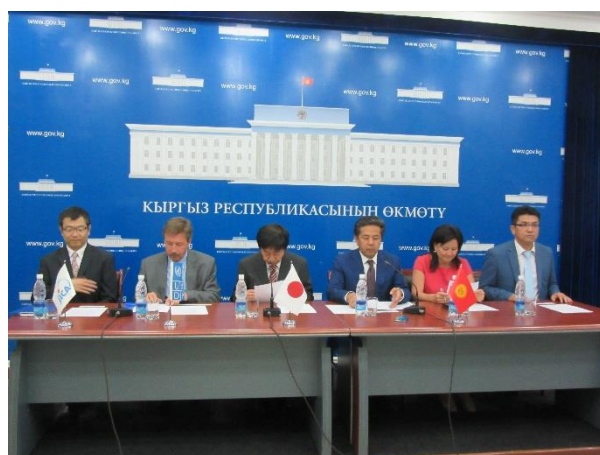
Участники Церемонии передачи оборудования