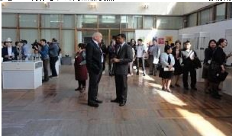
巡回展開会日の美術館ガラスの間