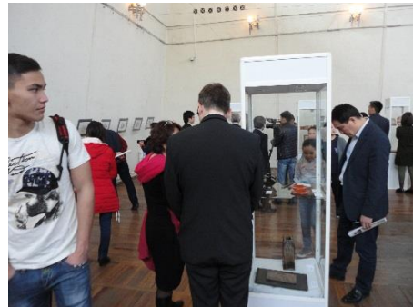
展覧会訪問者の様子