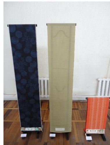
着物用の伝統布素材