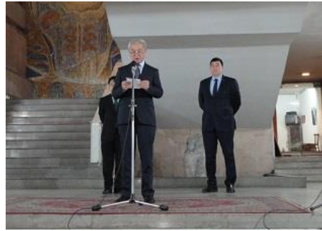
サキモフ・キルギス文化・情報・観光省官房長挨拶