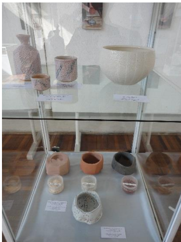
日本各地にて制作された陶磁器製品