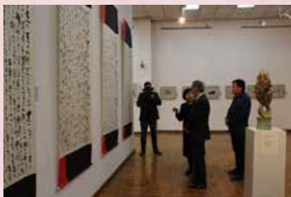
Знакомство с работами известного мастера каллиграфии Рюэски Моримото