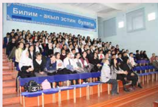
Зрители в сборе

После обеда представители Посольства Японии и Кыргызско-японского центра человеческого развития провели краткую презентацию про образовательные программы в Японии на грантовой основе для учениц турецкого лицея г.Токмок и ответили на их вопросы. После беседы по образовательным программам участникам встречи показали полнометражный художественный фильм «A Tale of Samurai Cooking», предоставленного Японским Фондом.