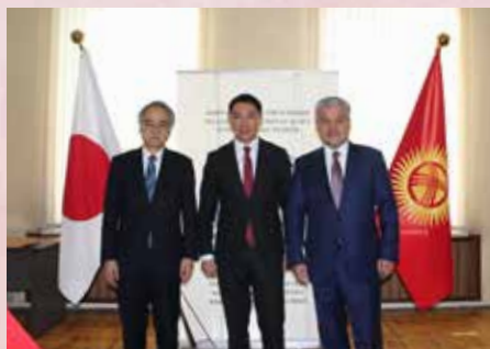
На фото слева направо ЧПП Японии в КР г-н Ёсихиро Ямамура, Министр культуры КР г-н Азамат Жаманкулов и Директор Кыргызской Национальной Филармонии г-н Кыргызбай Осмонов

Грантовая программа «Маломасштабная помощь в сфере культуры» осуществляется в КР с 2009 года. В рамках данной программы в Кыргызстане было реализовано 7 проектов.