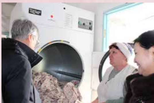
Демонстрация сушильного аппарата в ТПССУ