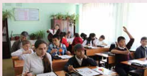
На занятии по каллиграфии