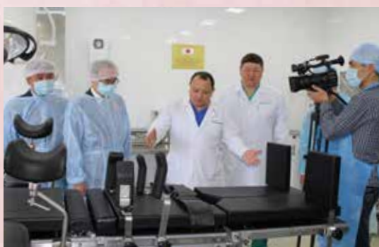
Презентация особенностей ортопедического операционного стола

7 февраля 2019 года состоялась церемония передачи оборудования по «Проекту по улучшению условий проживания в Токмокском психоневрологическом социальном стационарном учреждении №2» в рамках грантовой программы Правительства Японии «Корни травы и человеческая безопасность».