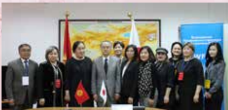
ЧПП Японии в КР г-н Ёсихиро Ямамура с грантополучателями

1 и 4 марта 2019 года в здании Посольства Японии в КР состоялись Церемонии подписания грант контрактов в рамках грантовой программы Правительства Японии «Корни травы и человеческая безопасность».