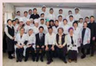
Памятное фото участников МК

Участники мастер класса узнали больше информации о пищевой культуре, традициях и тонкостях приготовления традиционного комплексного обеда из трёх блюд: караагэ (жареные куриные кусочки с хрустящей корочкой), онигири (рисовые колобки) и мисо-суп (традиционный суп с добавлением бобовой пасты на бульоне из морепродуктов). Ученики и учителя отметили, что уникальность мастер класса состояла в том, что все блюда просты в приготовлении и полезны для здоровья. По окончании мастер класса большинство его участников выразили желание посетить Японию и узнать ещё больше о японской кухне.