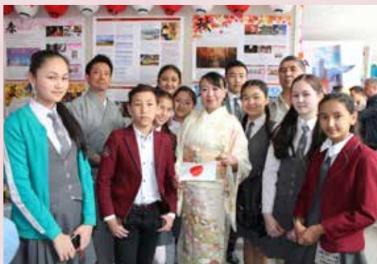
Ученики в гостях у Японии