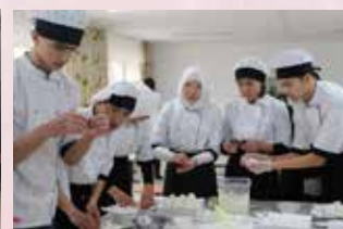
Ученики ПЛ пробуют сделать онигири