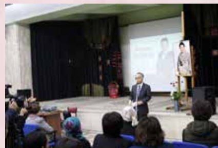
Выступление ЧПП Японии в КР г-на Ёсихиро Ямамура на открытии выставки японского искусства