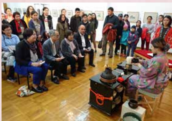
Чайная церемония с участием экс-президента КР г-жи Розы Отунбаевой и ЧПП Японии в КР г-на Ёсихиро Ямамура