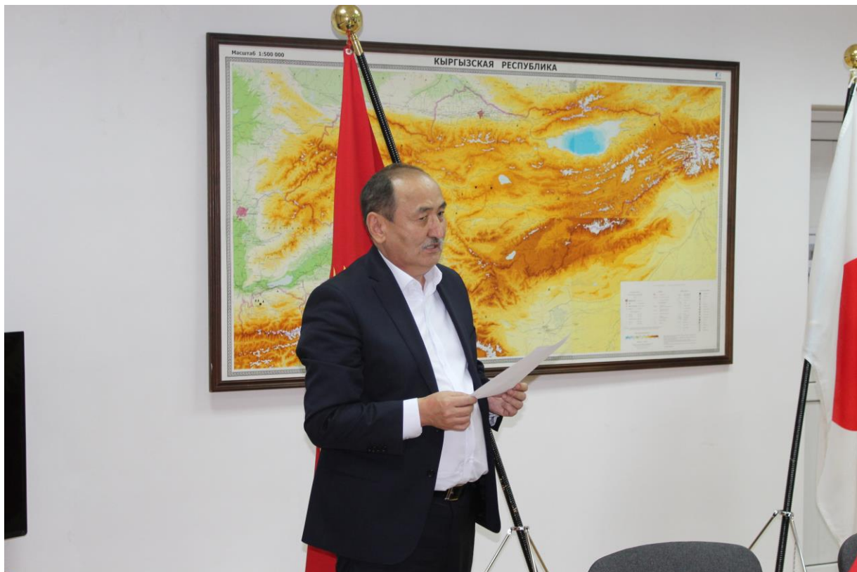
На фото: Министр здравоохранения Кыргызской Республики г-н Бейшеналиев Алымкадыр