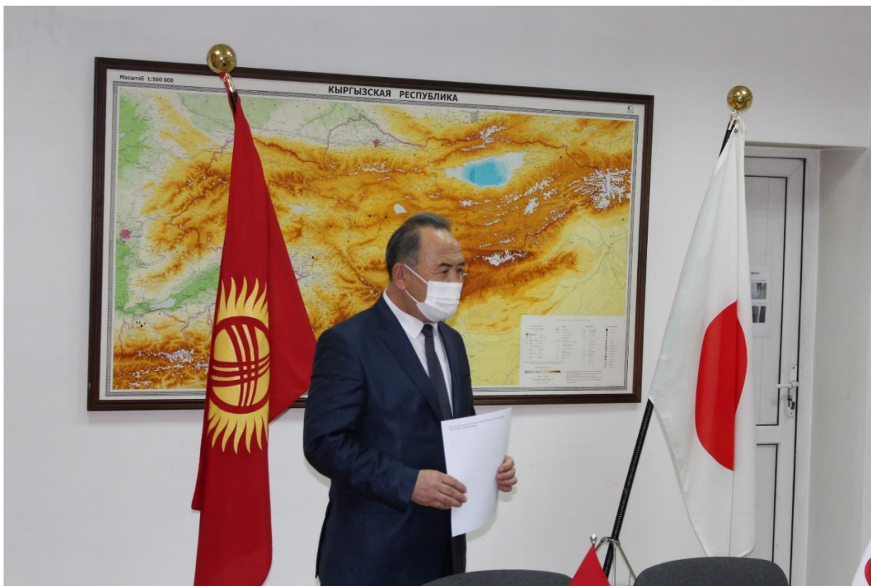
На фото: Заместитель министра здравоохранения Кыргызской Республики г-н Рахматуллаев Жалалидин